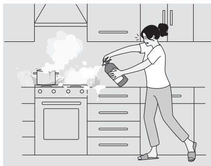
Rajah 2 / Diagram 2

Kebakaran boleh berlaku di mana-mana sahaja termasuklah di dapur rumah yang mampu memusnahkan harta benda dan mengorbankan nyawa. Alat pemadam kebakaran sangat diperlukan dalam situasi sebegini dan mesti ada di setiap rumah.