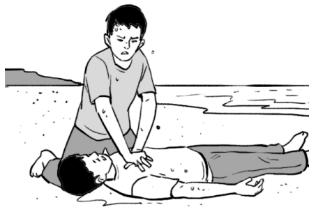
Rajah 2 / Diagram 2

Diagram 2 show a man saving a drowning victim.