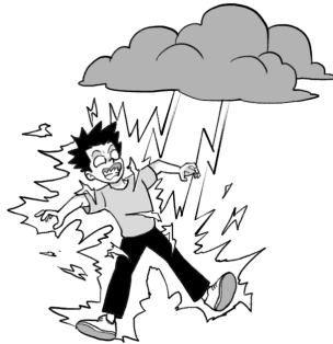
Rajah 1.1 / Diagram 1.1