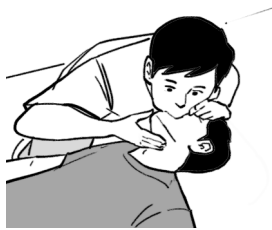
Rajah 1 / Diagram 1

Apakah konsep sains dan fungsi kaedah tersebut?