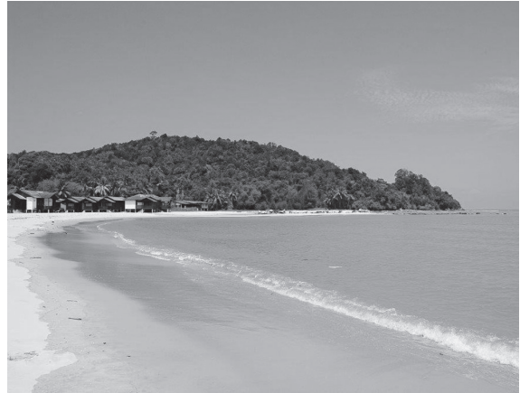
Pantai yang Indah