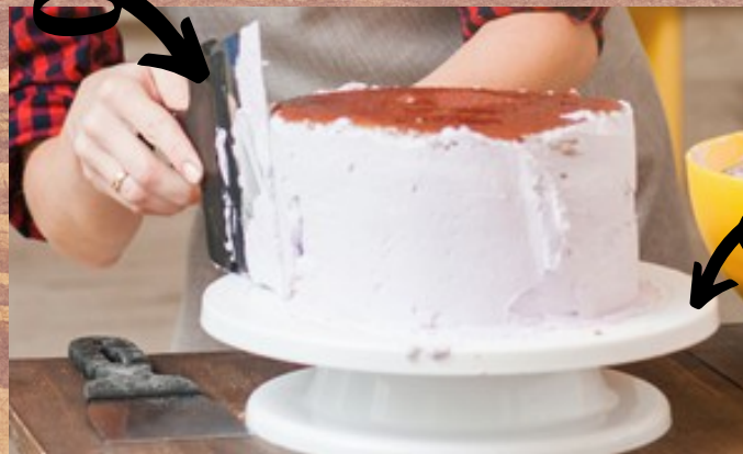
Meja pemutar kek