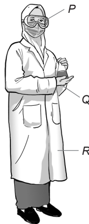
Rajah 1.1 / Diagram 1.1

Diagram 1.1 shows personal protective equipment that need to be worn when carrying out a scientific investigation in the laboratory.