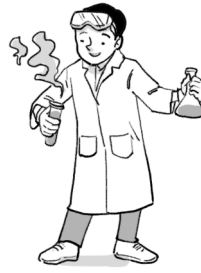
Rajah 1.2 / Diagram 1.2

Berdasarkan Rajah 1.2, kenal pasti dua kesalahan yang dilakukan oleh murid tersebut. Terangkan kesan kesalahan itu ke atas murid tersebut.